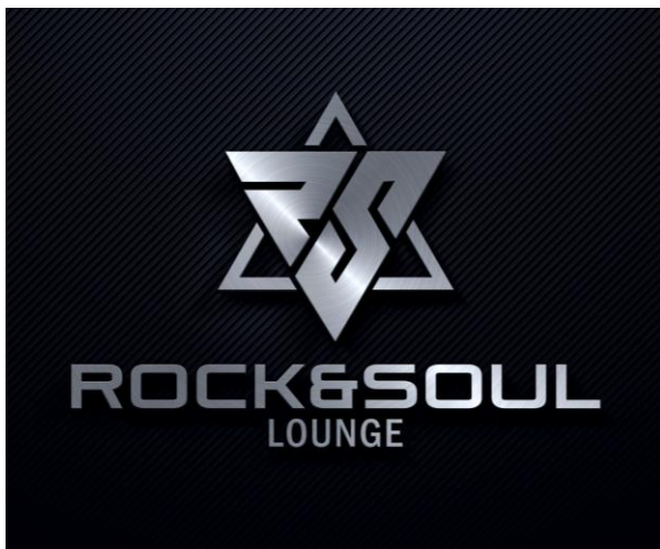
ROCK & SOUL LOUNGE

Die ROCK & SOUL LOUNGE ist eine Matrix von Profimusikern, die sich je nach Event in verschiedensten Live-Formationen wiederfindet.