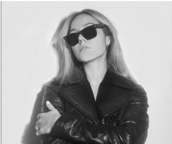
DJane und Musikproduzentin