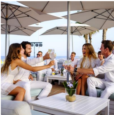
White Beach Night

Der Aldiana Club Costa del Sol erwartet dich mit diesen Entertainment-Highlights :