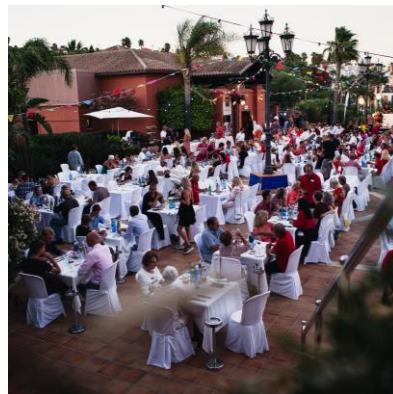
Open Air Dinner