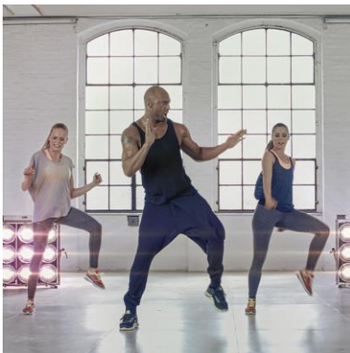
Tanz dich fit mit Detlef Soost

Zusätzlich zu unserem GroupFitness Programm gibt's noch eine extra Portion Sport und Wohlbefinden: