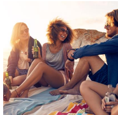
Sundowner am Strand