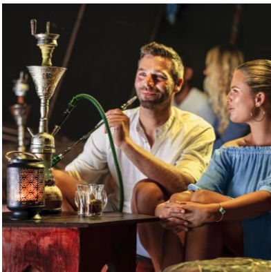
Morocco meets Costa Night am Strand